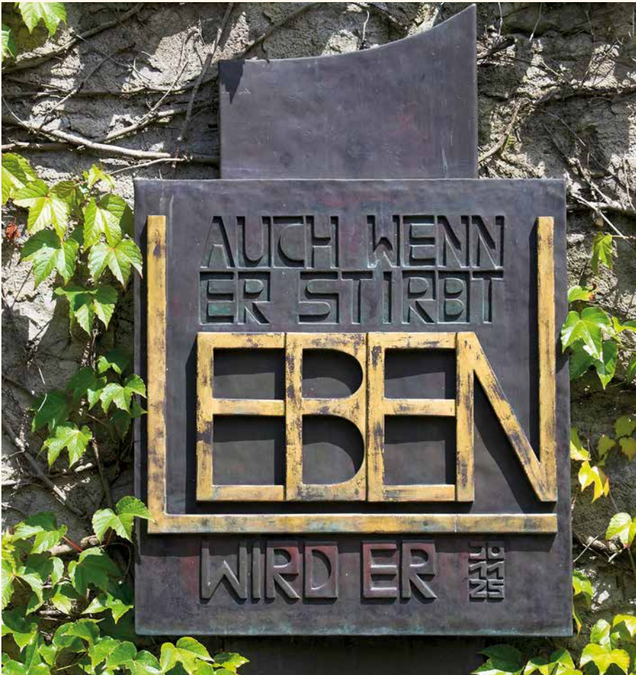
Friedhof, Benediktinerabtei Münsterschwarzach