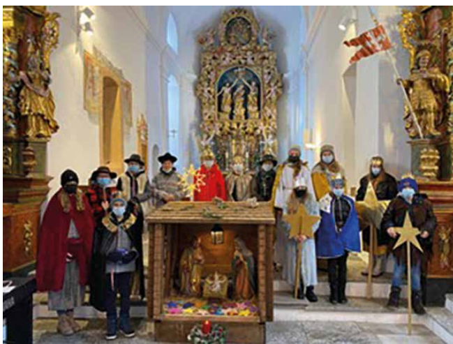
Foto: Die Sternsinger zu Coronazeiten mit Masken...

Wir gratulieren zum 30-jährigen Jubiläum und bedanken uns bei den Schulkindern und Lehrpersonen für ihren lobenswerten Einsatz während all den Jahren. Ein herzliches Vägält's Gott geht auch an alle grosszügigen Spenderinnen und Spender.